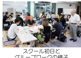
スクール初日とグループワークの様子