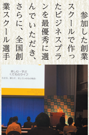
楽しむ・学ぶ くだものライフ 生きる、暮らす、そしていのちの物語。

「参加した創業スクールで作ったビジネスプランを最優秀に選んでいただき、さらに、全国創業スクール選手権にエントリーさせていただきました。そこで、全国からエントリーされた157のビジネスプランの上位10人を選んでいただき、東京で最終プレゼンをしました。全国の素晴らしい取り組みをされている方々と交流でき、大変刺激になりましたし、自身のプランを