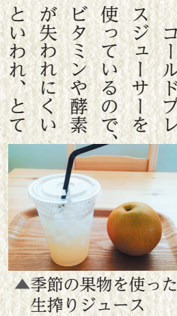
▲季節の果物を使った生搾りジュース

季節の果物と加工品、あとコーヒーや果物の生搾りジュース、ソフトクリームなどがテイクアウトできます。その場で果物を搾ってくれるんですね!では梨ジュースをいただきます。