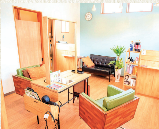
▲明るくゆったりくつろげる店内

「完全予約制のプライベートサロンです。小さなお子様連れの方も、他のお客様に気兼ねなくおくつろぎいただけます。夜8時まで受け付けていますので、お仕事終わりでもOKです。」