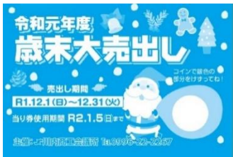
▲昨年度のスクラッチカード

<参加店のメリット> ・販促活動の促進 ・消費者とのコミュニケーション創出 ・当たり券を使用した消費の拡大 ・イベント性が消費を刺激 ・消費者の購入単価の増加