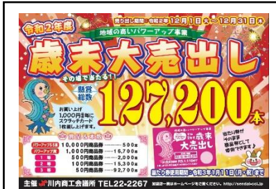
▲昨年度歳末大売出しのチラシ