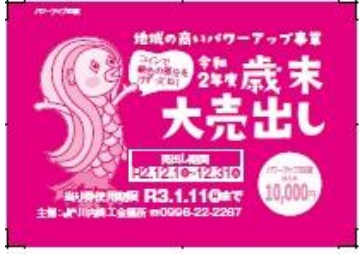
▲昨年度歳末大売出しスクラッチ